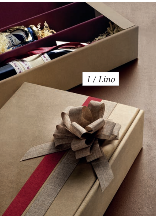
1 / Lino