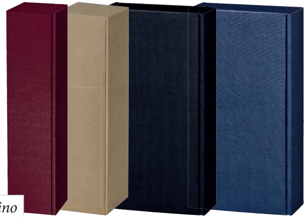
1 / Lino

Die abgebildeten Geschenkverpackungen in diesem Katalog sind in der Regel nur Beispiele und können jederzeit nach Ihrem Geschmack umgestaltet werden. Nachfolgend möchten wir Ihnen ein paar Möglichkeiten aufzeigen aus denen Sie wählen können. Darüber hinaus finden Sie weitere Verpackungsideen bei uns im Weinhandel Bürgerheim, bitte sprechen Sie uns an.