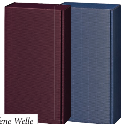
1 / Offene Welle